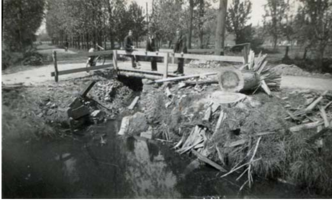
De opgeblazen brug over de Dijkgraaf

haast bij. Dat kan altijd nog als de Duitsers dicht in de buurt zijn en dat kan nog wel een paar dagen duren.”