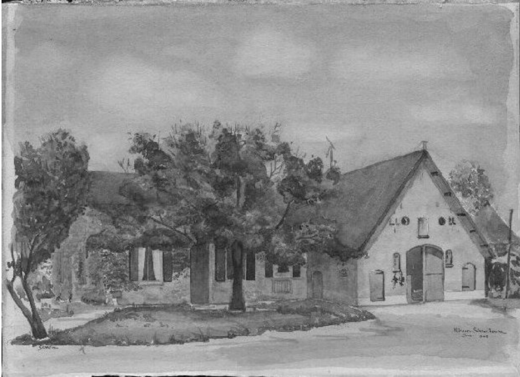
Tekening van de boerderij aan de Dijkgraaf 35

en een fiets meer of minder komt er tenslotte niet op aan.” De drie boten liggen tegen elkaar, zóó dat men van de eene boot op de andere kan stappen. Een sleepboot wordt er voor gezet, touwen worden losgelegd en daar gaan we “op hoop van zegen!” We wuiven naar de jongens op den wal en we denken: “Zouden we elkaar wel ooit weer terugzien?” Het is nu ongeveer half twee en naar we later hoorden, waren de Duitschers toen al voorbij Arnhem, zoodat ze ons dicht op de hielen zaten.